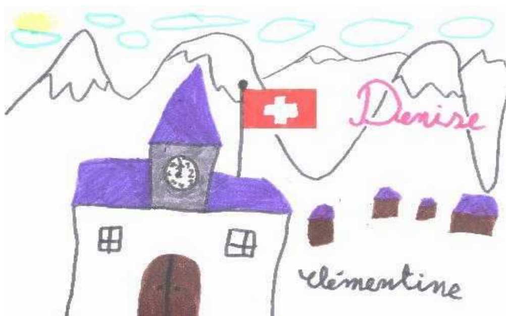
Dessins de Clémentine, 7 ans Une petite française